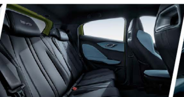
Espacio Interior Optimizado