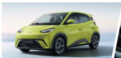
300KM / 380KM NEDC de Autonomía®