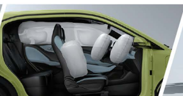
Equipado 4 / 6 Bolsas de Aire