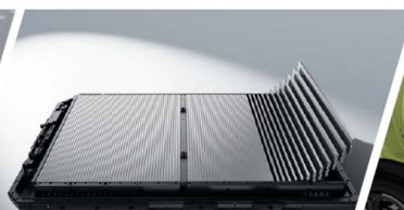
Ultra-Safe Batería Blade