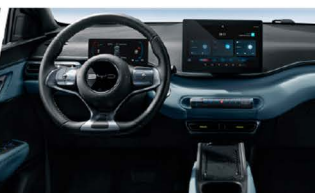
Sistema de Cabina Inteligente BYD