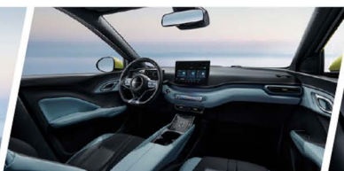
Cabina Ocean Chic