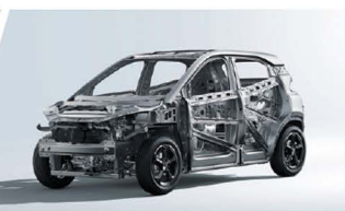
Estructura Corporal de Alta Resistencia